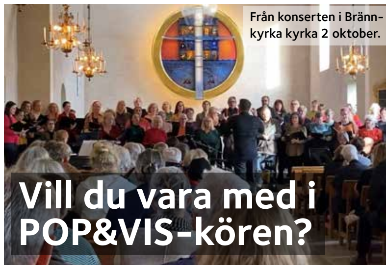
Från konserten i Brännkyrka kyrka 2 oktober.