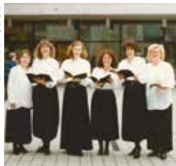
Glada korister 1992.