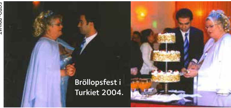
Bröllopsfest i Turkiet 2004.

– Jag har alltid varit socialdemokrat, men inte särskilt partipolitiskt engagerad, och har nog egentligen åsikten att kyrkan inte ska vara politisk, säger hon.