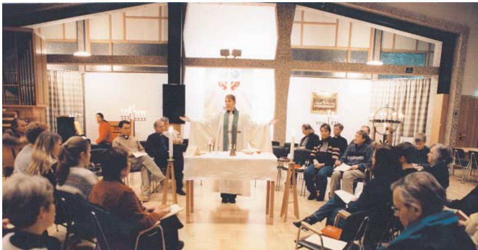
Fruängens kyrka. Tillsammans skapar vi en ny gudstjänst.

10.00 i Brännkyrka kyrka lördagarna 15 februari, 15 mars, 12 april, 10 maj